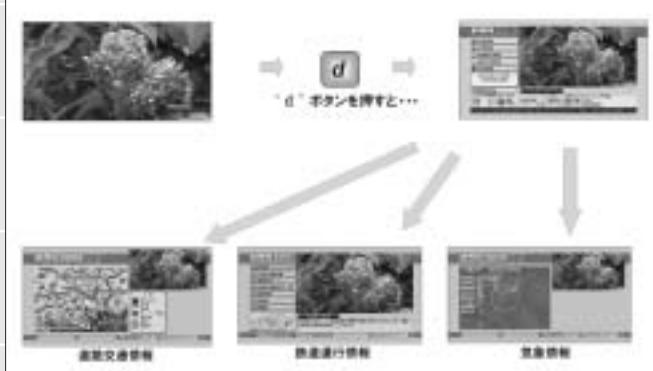
図1 データ放送のサービス画面イメージ

(Broadcast Markup Language) とECMA Script (エクマスクリプト) という言語で記述されたデータを番組として配信するサービスで、さらにはデジタルSTBに搭載されたインターネット端子からIP接続することにより、双方向サービスがテレビ上で実現するサービスである。データ放送はすでにBSデジタルや地上デジタルでもサービスが開始されており、サービスはすぐにイメージできるかと思われるが、視聴者はSTBの“d”ボタンを押下することでテレビ画面上にデータ放送画面を表示することが可能である。その画面または遷移先の画面から気象情報や道路交通情報、鉄道運行情報、ニュース、防災情報、自治体情報などと共に、地域に密着した情報を得ることを可能とするサービスである。コンテンツとしてはTS (Transport Stream) で視聴者へ配信される「放送コンテンツ」と、詳細な情報などはIP通信経由でインターネット上に設置されたBML配信サーバーから「通信コンテンツ」として情報を得ることが可能である(図1参照)。